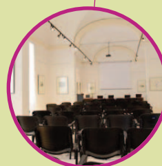
Sala Serpieri Collegio Raffaello