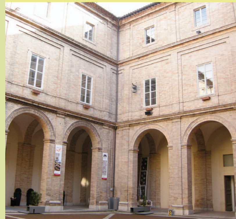
Collegio Raffaello Urbino