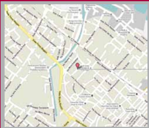
Parcheggio XXIV Maggio

Si avvertono i gentili partecipanti che in occasione del Corso il Parcheggio XXIV Maggio in via XXIV Maggio/Corso Matteotti, normalmente a pagamento, sarà di libero accesso .