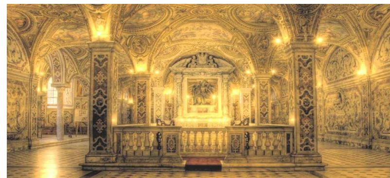
Cripta Duomo di Salerno